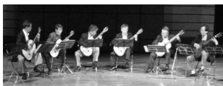
まほろば カプリシャス

大阪市立大学「ギター部」出身のOBグループ。 1960年代後半を共に過ごした仲間が、リタイア後の楽しみにギター演奏を再開。熟年9名が年齢を忘れ、ギターアンサンブルを楽しんでいる。